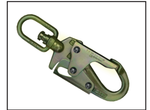
IKV 33 (ANSI Z.359.1-2007; CSA Z259.12-2011) mit Fallanzeiger